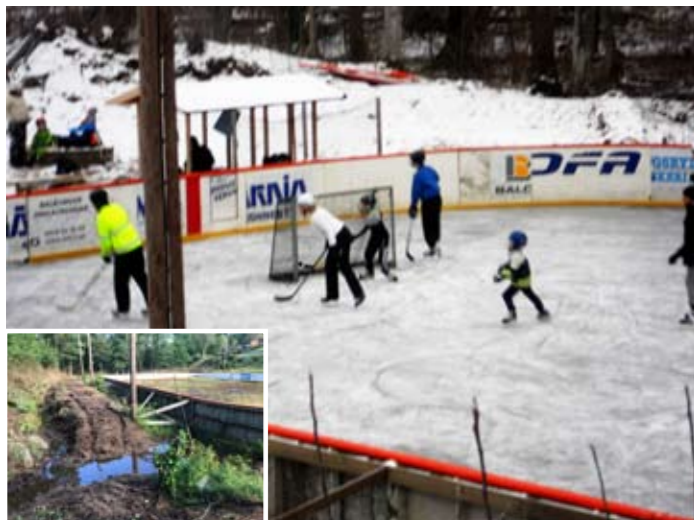
Isbanana / Hockey / Lekplats / Bad / för de yngre barnen i Backaryd, vinter och sommar. Isbanan var i behov av att dikas så att vattnet inte skulle rinna genom banan. För en naturbana som denna är förutsättningen att kung Bore ser till att temperaturen ligger på minussidan samtidigt som inget annat försvårar så att isen blir hållbar för att åka skridskor på.