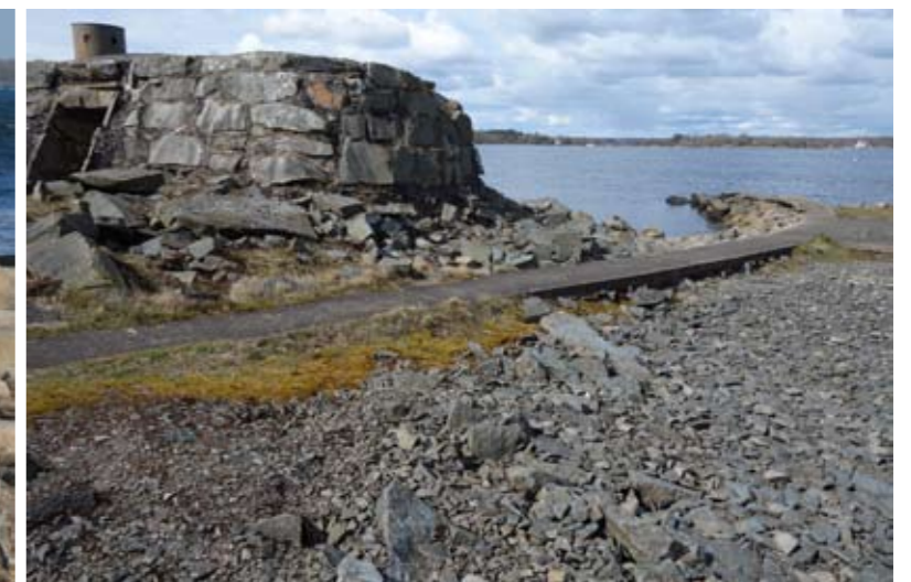
Aspan ligger litet för sig själv intill Ronnebyfjärden. Här finns även Aspans kursgård. Barnens vandringsslinga på Aspan har gjorts, för att bli förklara och väcka intresse för befästningarna från första världskriget och stenbrytningen..