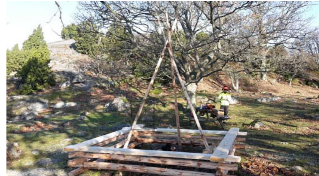
Restaureringen av grillplatsen på spetsen av Järnaviksudden har länge varit önskad liksom röjningarna i kringområdet. Uddens yttersta spets är verkligen en social plats av stort värde.

I sen tid har en hel del nya satsningar gjorts i Järnaviksskärgården, med Ark 56 och det tillhör idag ett av världens trettio biosfärområden! För försköningspengarna var det länge ett "vitt område". Här fanns inga satsningar alls. Men med Skärgårdsförningens tillkomst 2018 och en samverkan med Bygd i samverkan så kunde en rad insatser under 2019 riktas mot Järnaviksskärgården så att en långtgående igenväxning bromsades och så att flera olika delar samtidigt lyfts fram. Insatser har gjorts kring båthamnen, längs Kamrastigen i det största Järnaviksreservatet, liksom på Järnaviks udde, på utsiktsberget ovanför Järnaviks camping, längs Blekingeleden, längs Svalemålaleden och längst ut på Garnanäs.