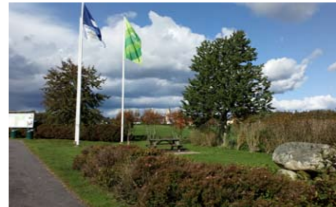
Södra infoplatsen välkomnar besökare till Bräknebygden

Sedan några år tillbaka har Bygd i Samverkan erhållit skötselmedel för Svenmanska parken och övriga besöksplatser. Skötselpengarna har sedan fördelats på skötselgrupp och medverkande föreningar. En mycket positiv förändring av försköningspengarna, då de numer även kan riktas mot underhåll, vilket innebär att gjorda försköningsinvesteringar kan utvecklas vidare via ett bra underhåll. Nedan ett urval av de försköningsobjekt Bygd i Samverkan har ansvar för.