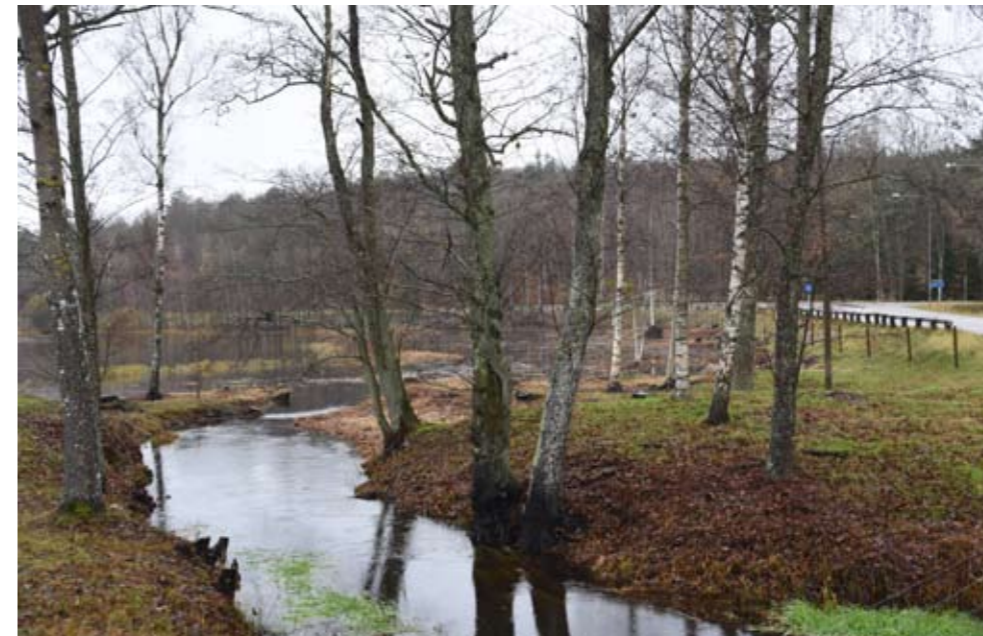
Miljö med Årsjön och Vierydsån vid Backaryd. För samhällets utbyggnad föreslås ett nytt bostadsområde med utsikt över och närhet till Årsjön. Här är samtidigt avsikten att kunna anlägga och förbättra för att nå ett nytt gång- cykelstråk till Skörjesjön, Backaryds badsjö och utflyktsmål nummer ett. Även gångstråket i sig själv skulle här bli till en attraktiv miljö förbi Årsjön, Stora Årsjömålgården, Vierydsåns utlopp i Årsjön, med hagmarker, rullstensåsar och bokskog för att sedan kunna utvecklas vidare mot både Örseryd och Silpinge.