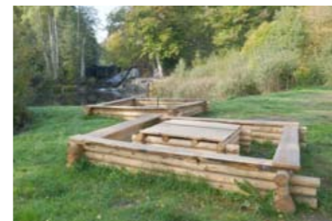
Det omtyckta besöksmålet Snittingfallet är en av Bräkneåns vackraste besöksplatser.