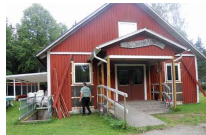
Då bygdegården snyggades upp, stod försköningspengarna för renovering av scenen både ute och inne. Även vid fönsterbyte samt för material till målning och tapetsering, som utfördes ideellt spelade försköningspengarna en viktig roll..