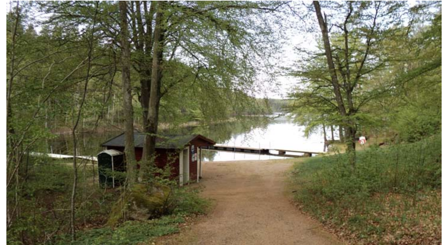
Skörjesjön med badplatsen är en fantastiskt fin plats på lagom avstånd från samhället. Den har ett fint vatten och är omgiven av spännande strandstigar och skogar som kan fungera som utflyktsområde under hela året. Här har förbättringar gjorts inom ramen för Försköningspengar. Österut finns andra sjöar i närområdet, som Vitavatten, Stora Angsjön och Djupasjön, som utpräglade klarvattensjöar, med samtidiga höga upplevelsevärden i kringområdet.