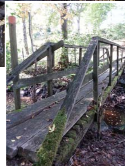
Bron vid Lillån byggdes och monterades helt ideellt. Försköningspengar bekostade materialet. Båge sidorna av vägen som utgör entrén till byn från väg 27 till kyrkan var tidigare helt överväxt. Med röjningen som möjliggjordes av försköningspengar så fick man tillbaka känslan av att detta var viktiga kulturella platser och stråk i Öljuhult.