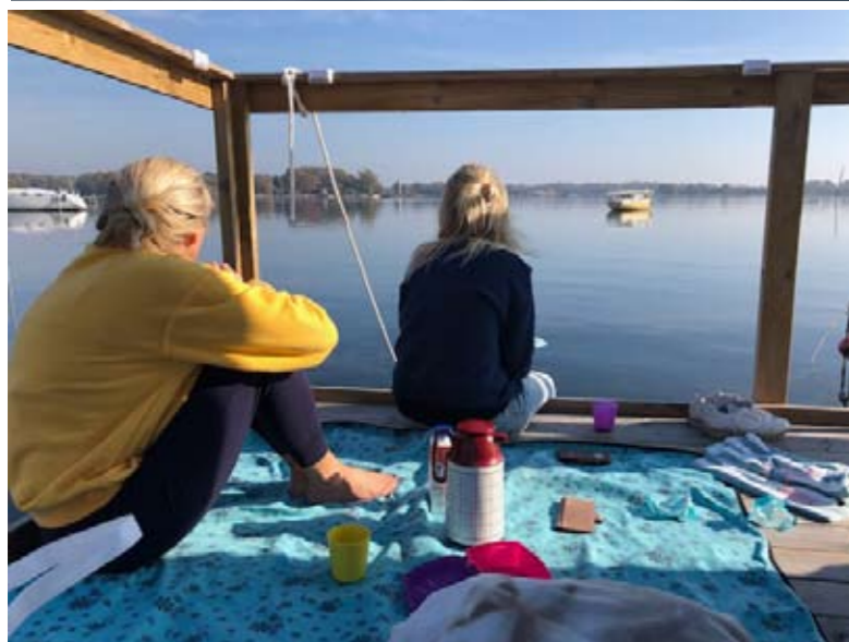
Bastufloften är till för alla och är välbesökt under hela året.