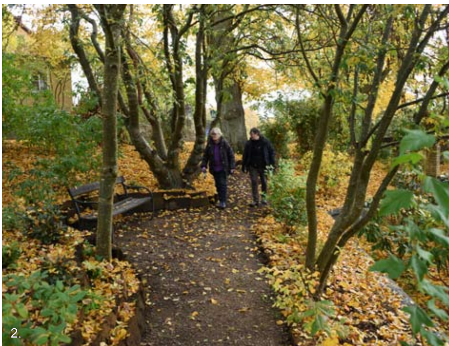
Svenmanska parken, Bräkne-Hoby 2015