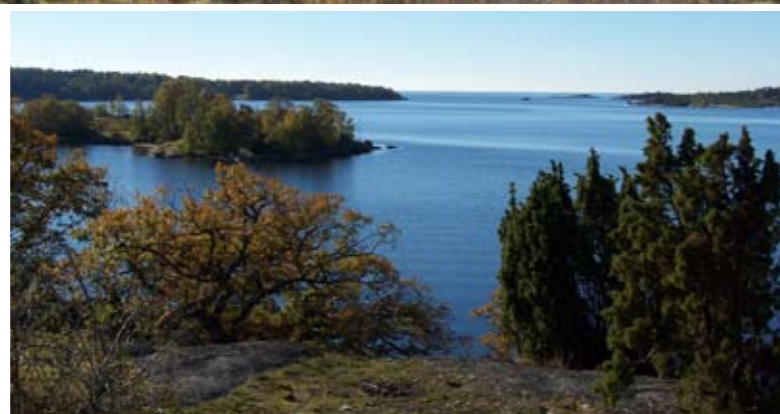
Utsikt över Järnaviks skärgård, från Sillaberget, Järnavik