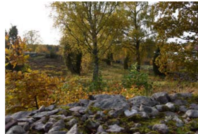
Försköningsmedel för att öppna upp nytt gångstråk från Hoby skolan och norrut knutet till Bräkneåsen. Därmed öppnas det upp för helt nya upplevelser som tills idag funnits där helt dolda. Miljöer som Pestkyrkogården och en skarprydd ås med backar och lundpartier, förbi aktivitetsparken.