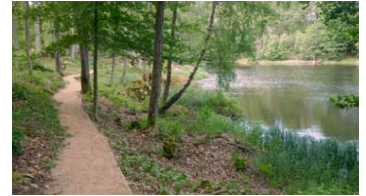
Bräkne-Hoby norra friluftsområde Ekfors – Dönhult som ligger i en exotisk naturmiljö intill dammen vid tidigare ett av Sveriges första bondeägda kraftverk.