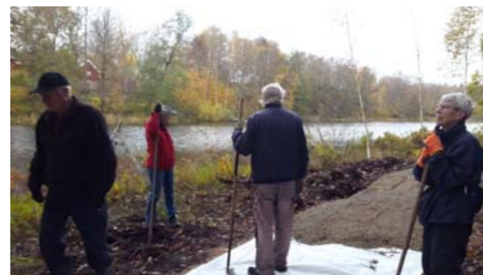
Under 2020 siktar man på att anlägga Nordenskölds park i Eringsboda, som avses bli en viktig samlingsplats och stärka känslan av centrum. Den kan i framtiden lätt knytas ihop med gångstråket runt Togölen.