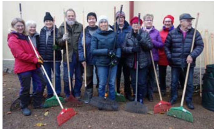
Skötselgänget i Svenmanska parken - sommar som vinter