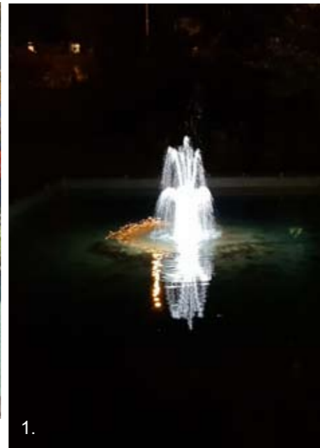
Ögonblicket under invigningen då fontänen äntligen är i gång igen