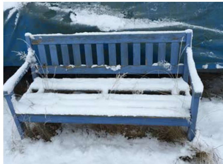
Den bortglömda bänken.