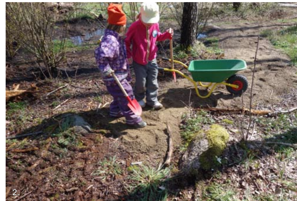
2. Listerby samhälle med en urban kultur som idag lever vidare sida vid sida med en landsbygdskultur, även i samhällets centrum. Barnen tar intryck av bägge. Här bygger de sin egna minivägar i sin förskoleskog