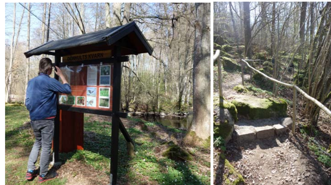
Nybyggd informationstavla och trappa samt hasselräcke, Ekfors - Dönhult kvarn, 2019.