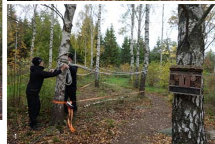
1. Miljöbilder från förskolan i Listerby 2. Skolskogen i Listerby