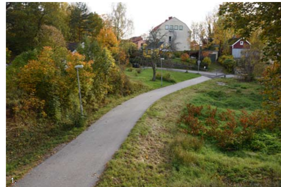
1. Bräkne-Hoby samhälle. Detta grönstråk är ett av samhällets få centrala grönstråk. Försköningsmedel för att öppna upp gångstråk från Hobyskolan och norrut har nu, 2019, givet en förbättrad situation, knutet till Bräkneåsen och de fina men dolda miljöer som funnits där, men fram tills nu inte varit tillgängliga.

Utvecklingen av Svenmanska parken från 2014 började som ett stort försköningsprojekt och ytterligare steg har stötts. Parallellt så har ett stort arbete riktats mot naturskön natur som besöksplatser. En fågel-skådningsplats anlades vid Järnavik, informationsplats anlades vid E22:ans avfart, avfarten in mot stationen förbi Ekbacken har lyfts. Det kan man även säga om Snitting som plats, med röjningar och anläggning av trätrappa och grillplats. Men användandet av platsen i sin helhet är fortfarande omöjlig utan bro nedanför och inget stråk leder vidare in i samhället. Nu är man med försköningsmedel på väg att ta ett initialt steg för att öppna upp det första centralt liggande grönstråket som knyter in "Aktivitetsparken" i ett stråk samtidigt som det visar upp den oskadade delen av Bräkneåsen och Pestkyrkogården som med topografin och de vällagda, vinglande stenmurarna är ett litet mästerverk som bygge.