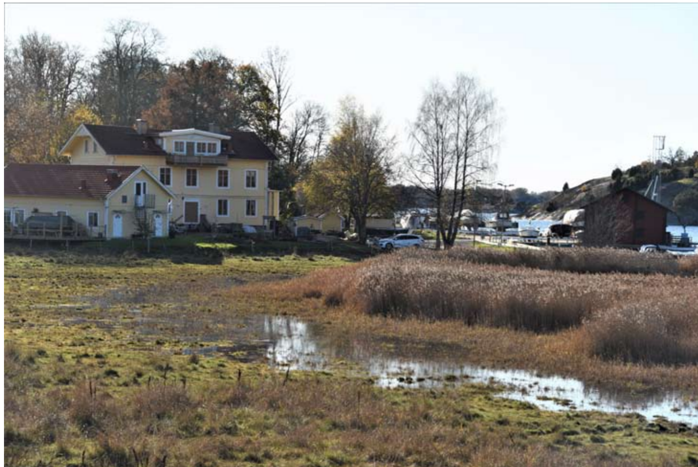
Båthamnen, Järnavik med Järnaviks pensionat.

Många tänker direkt på Järnaviks båthamn och visst utgör detta ett kärnområde och en strategisk plats för turism, men Järnaviksskärgården är så mycket mer. Huvudön Tjärö, Garnanäs, Svalemåla, Gyön, Bräkneåns mynningsområde, Mörtströmmen, kustvägen mot Saxemara och Ronneby, och inlandet med de ofta utsökt liggande stora gårdarna och radbyarna. Järnaviksskärgården har dessutom en stor sommarbebyggelse och ett stort antal leder och naturreservat.