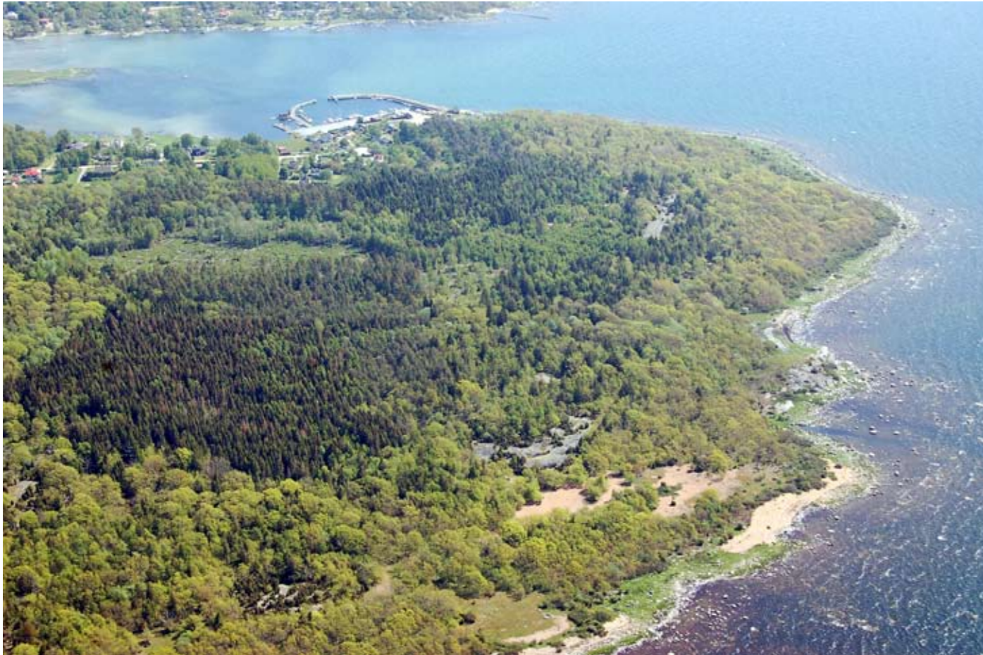
Kustbygd med Gökalv, ett populärt klassiskt utflyktsområde för havsbad för Ronnebybor.