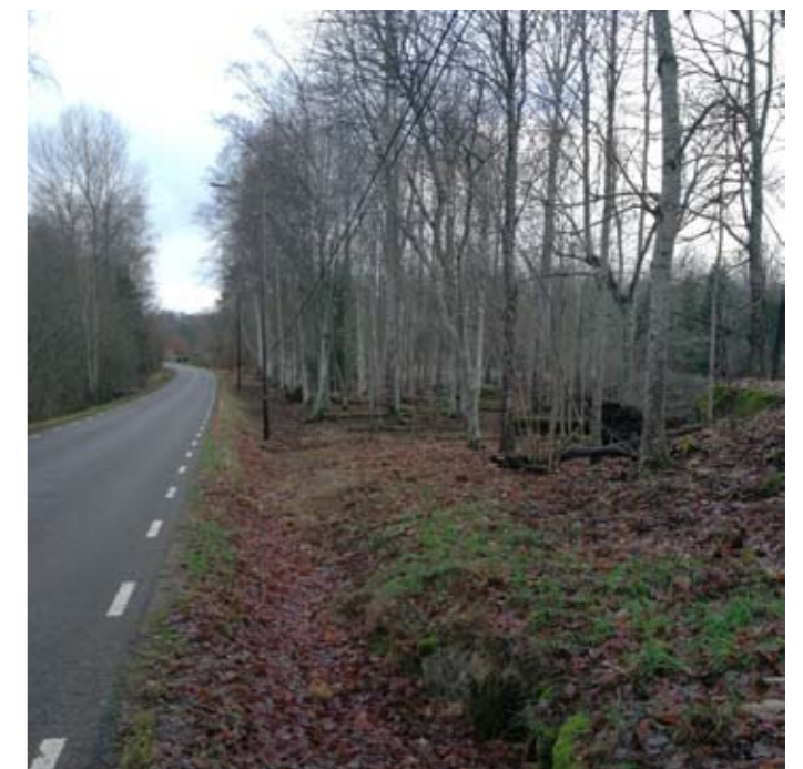
Entrén till byn från väg 27 till kyrkan var tidigare helt överväxt. Röjning möjliggjordes av försköningspengar.