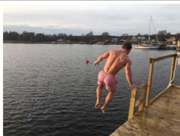
Bastufloften ligger under sommarhalvåret ute i Saxemaraviken och under vinterhalvåret inne vid varvet. Tack vare försköningspengar har även en båt kunnat köpas in. Dessutom har en bryggplats kunnat byggas.