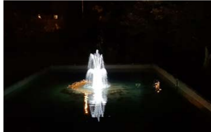
Den nyrestaurerade dammen i kvällsbelysning