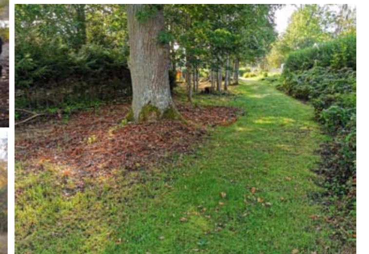
Ett flertal områden har åtgärdats i Eringsboda: Underhåll av promenadstigar och grönområde i anslutning till lekplats samt underhåll av mark i anslutning till genomfartsleden genom samhället.