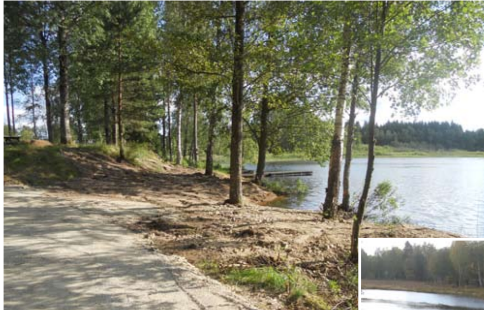
Då ombyggnaden av vildmarksleden vid Båtasjön gjordes anlades sandstranden och gräsmattan vid grillplatsen.

Öljuhults Samhällsförening har sökt och fått försköningspengar till flera olika projekt. De har valt vid flera tillfällen att uppgradera pengarna med eget ideellt arbete. Det ideella arbetet och försköningspengarna gör att byn lever upp. Både boende och besökare känner att byn vaknat till och flera barnfamiljer har flyttat in. Det finns hopp om Öljuhult.