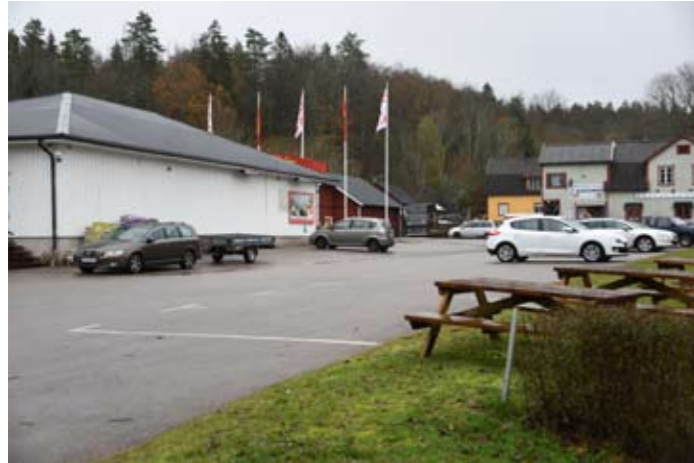
Tre bilder som visar Backaryds centrum, med flerbostadshus, dagligvaruaffär, restaurang, bygdegården Regina, allmän lekplats och två av samhällets gång-cykelstråk.

Försköningsmedlen har varit viktiga för underhållsarbeten av bygdegården Regina och för underhållsskötseln av grönytor på kommunal mark. Det gröna som central resurs i samhället syns tydligt och Backaryd finns i hög grad med vid användningen av försköningspengarna för underhållet av dessa grönytor.