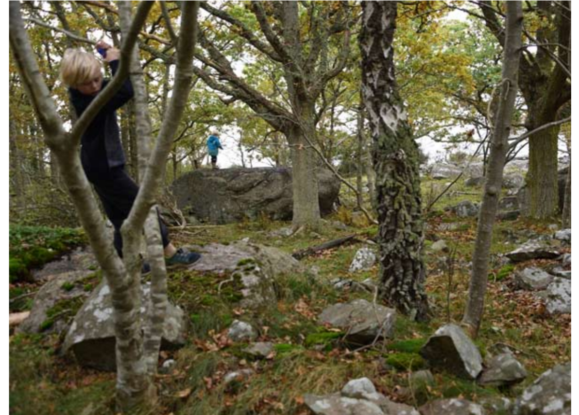
Naturskogen på Lindö

Kuggebodalandet är en kustnära del av kommunen som är tätt befolkad med flera små samhällen och växlingar mellan glesare och tätare husgrupperingar, som i sin tur växlar med ett typiskt skärgårdsjordbruk, sommarbosättningar, permanentboende och natursköna partier som Lindö och Listerbyskärgården utanför. Det ligger dessutom i kanten mot Göholm som herrgårdslandskap och Gökalv som klassiskt område för Ronnebybor med sitt fina havsbud.