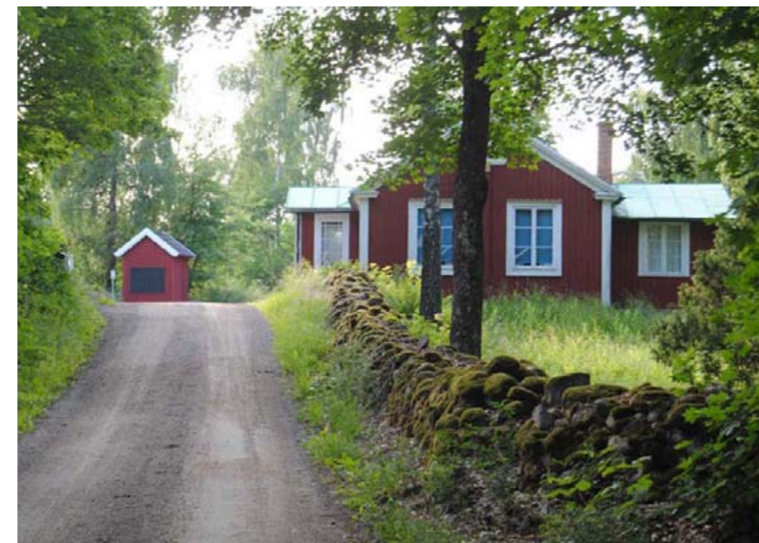
Örseryd gamla småskola och postboden

Enskilda objekt sticker ut om man ser det så här. Med Svenmanska parken så ökar differentieringen avsevärt liksom avståndet mellan ytterligheterna längs en gradient för försköningsobjekten totalt sett. Något som kan synas viktigt vid en bedömning av helhetsresultatet i arbetet med försköningspengarna. Här understryks snarare det kulturella, det artikulerade, människans närvaro för att lyfta fram trädgårdsatmosfären, det kulturella och det sofistikerade. Och jämsides med detta märks en mer ordnad och kontrollerad naturkaraktär, med en överrepresentation av de goda och attraktiva egenskaperna och en orädsla för att synas i samhället. Här finns också återknytningen i trädgårdsstil till nyklassicismen och till ett äldre växtmaterial med stora symbolvärden, samtidigt som man vill visa upp ett framtidens växtmaterial som ännu inte nått köpcentra på trädgårdssidan.