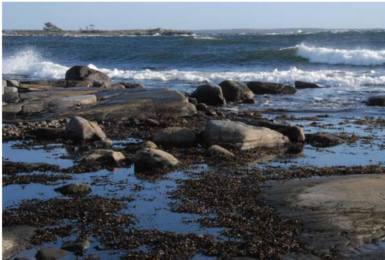
Storm vid Lindö