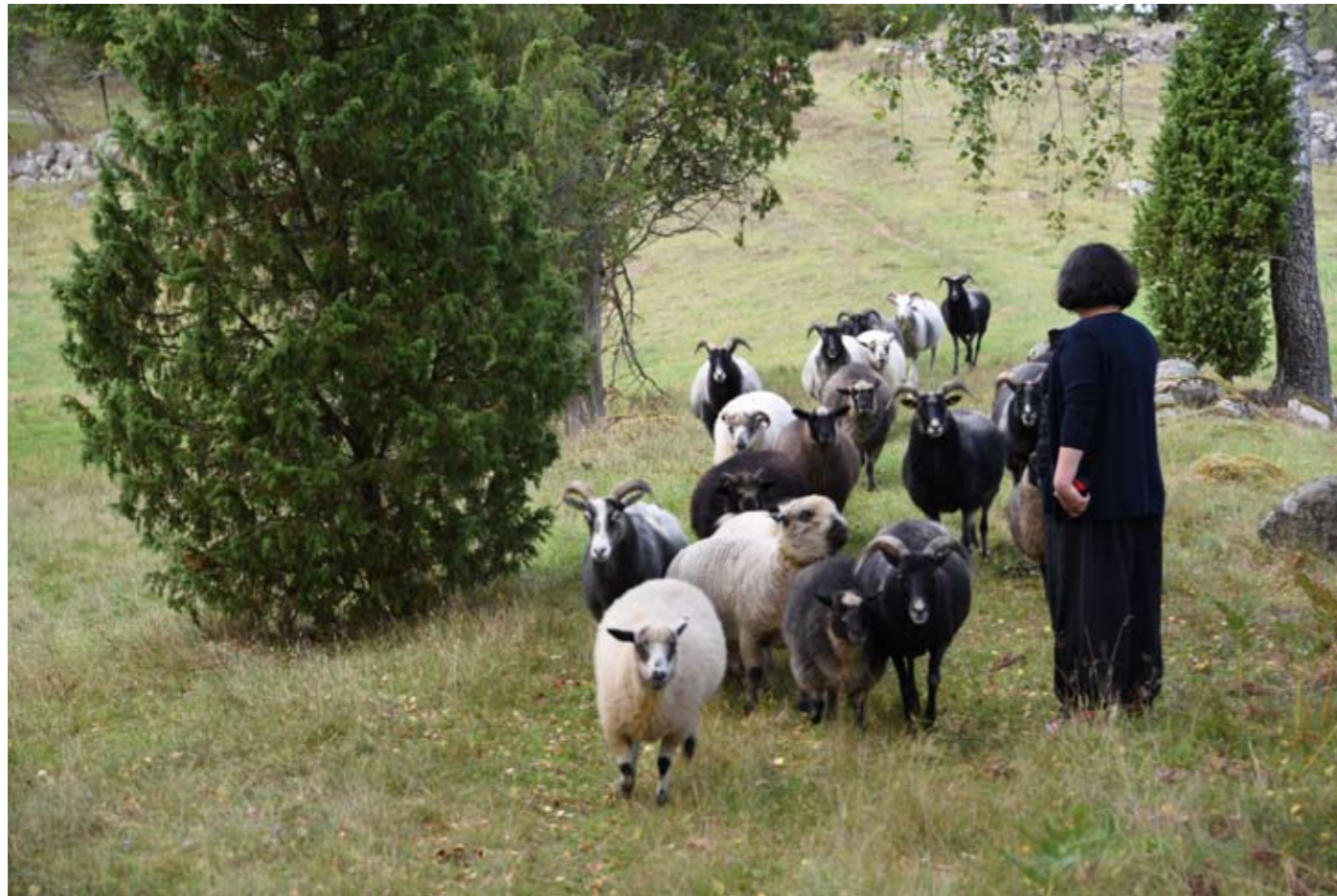
Strömmahejan vid Bräkneån ses här som ett allmänt exempel, för en miljö och ett sammanhang som kunnat vara ett försköningsobjekt men som kommit till och underhålls via enskild markägare.

En intressant fråga att försöka besvara är naturligtvis, om man ser till de över åren realiserade försköningsobjekten sammantaget. Hur kan man beskriva dem karaktärsmissigt? Vilken framtoning har de och vad knyter de an till för traditioner? Likheten mellan olika objekt är slående. Kanske man även kan se olika generationer av objekt. Perioden då man målar om eller på annat sätt restaurerar bygdegården har ebbat ut och själva utemiljöerna med dess platser och stråk har givets mer uppmärksamhet. Med de senaste åren så har spridningen dessutom blivit större. Framöver kanske de längre stråken som rörelsestråk och landskapsstråk är på väg in.