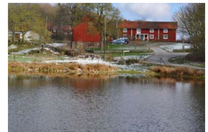
Silpinge kvarn och Kurran i Silpinge