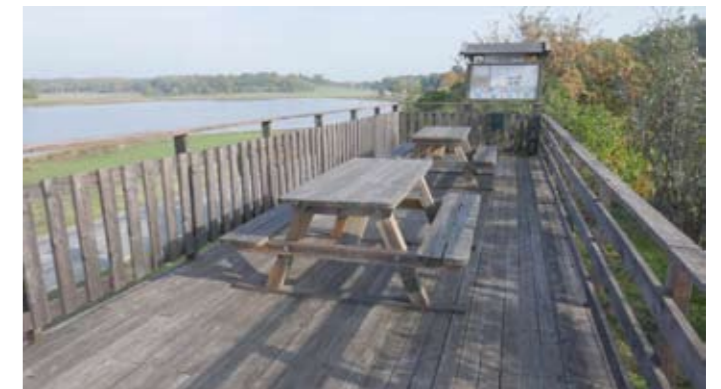
Järnaviks fågelskådningsplats vackert belägen vid entrén till Järnavik turistområde.