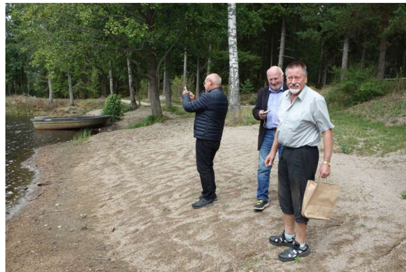
Tillverkning av sandstrand, Ölgehult 2018