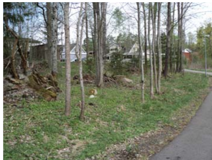
Gräsröjningen i Backaryd är en viktig underhållsskötsel. Den gäller för kommunal mark som lediga tomter och industrimark för att försköna samhällets centrala delar och visar att Backaryd är ett levande samhälle