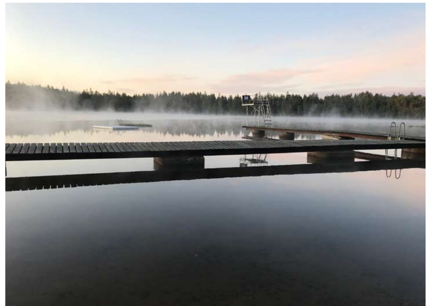
Lilla Galtsjön med badankor och dimmor